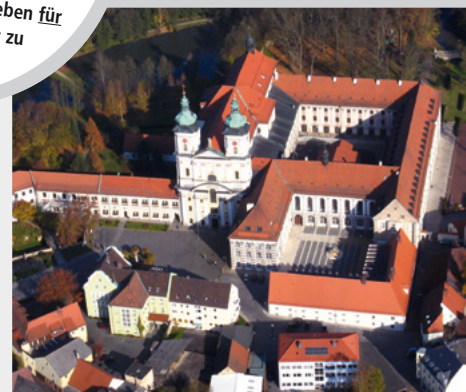
Kloster Waldsassen, Waldsassen/Oberpfalz

AUCH FÜR PAARE IDEAL! Denken Sie doch einmal darüber nach, wie Sie als Paar von LebensEnergie profitieren können: Gönnen Sie sich gemeinsam ein Seminar, das Ihnen hilft, Privat- und Berufsleben für Sie beide erfüllender zu gestalten!